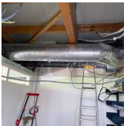
Remplacement de la climatisation de la médiathèque