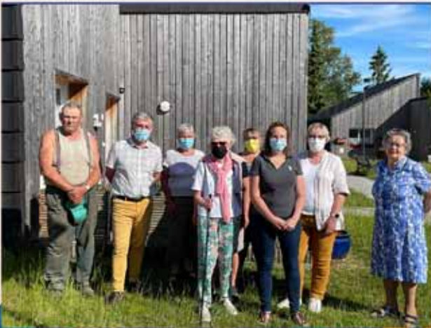
RENCONTRE AU BÉGUINAGE