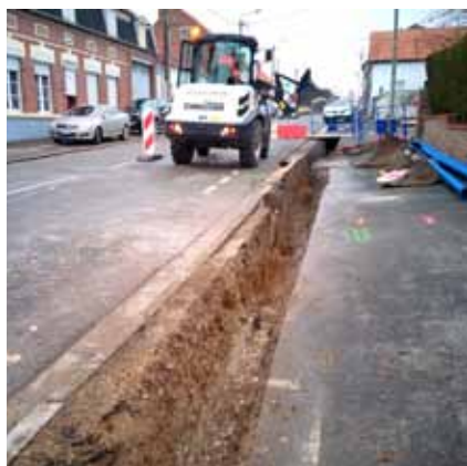
Renouvellement du réseau eau portable rue Roger Salengro

Avec l'aide de la Communauté Urbaine d'Arras et de nos services techniques communaux.