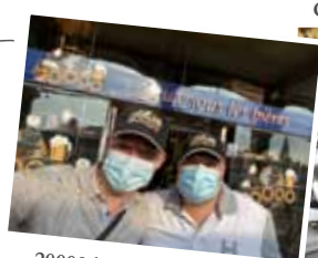
20000 jeux sous les bières