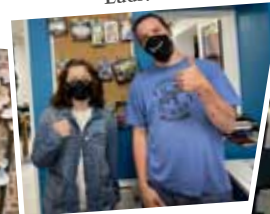
Auberge des saveurs