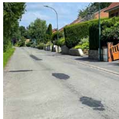
Travaux de voirie chemin du Bois Vincent

Voici la liste des travaux de Voirie Réseaux Divers réalisés ou programmés sur la commune, à savoir :