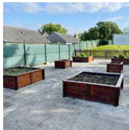
Nettoyage et préparation des aménagements extérieurs en vue des cours de jardinage

Durant la deuxième quinzaine d'août, les services techniques ont effectué les travaux d'entretien suivants au sein de nos écoles :