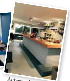
Auberge des saveurs