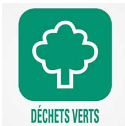
Dernier ramassage des déchets verts le lundi 25 octobre 2021

Des déviations routières seront mises en place durant ces travaux.