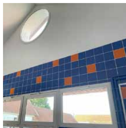
Travaux de plomberie et menuiserie dans les blocs sanitaires