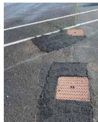
Traitement de nids de poiss dans les cours