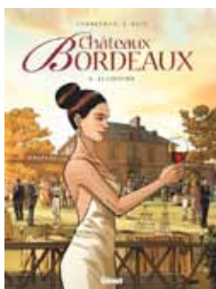
Châteaux Bordeaux Volume 6, Le courtier

Alexandra Baudricourt doit chercher des soutiens financiers après avoir repris en main le