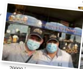
20000 jeux sous les bières