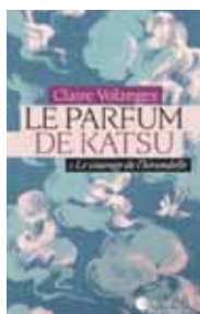
Le parfum de Katsu Volume 2, Le courage de l'hirondelle

traumatisant de la vie du défunt pour se plonger dans ses souvenirs d'enfance. Alors qu'il est militaire et qu'il négocie la libération des otages de Stanleyville au Congo, Patrick Nothomb se retrouve confronté de près à la mort.