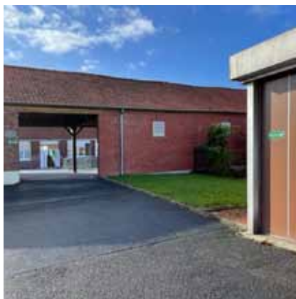
Curage des réseaux enterrés après une inondation dans les classes de l'école maternelle